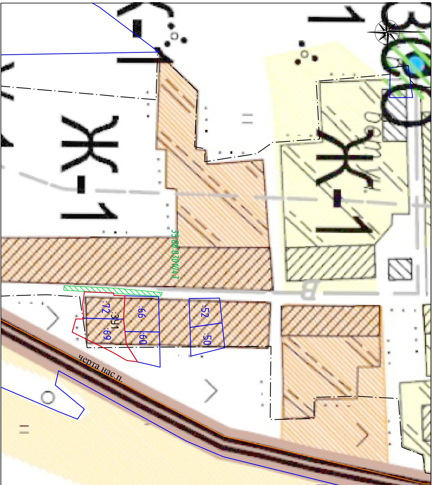
Схема расположения земельного участка в границах планировочной структуры (квартале)